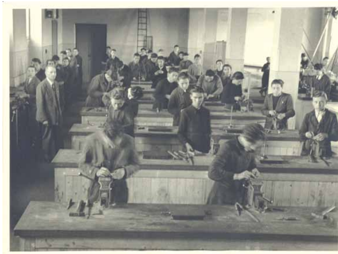
Immagine della scuola professionale "Ambrogio Necchi"

In seguito alla messa in sicurezza del complesso archivistico e al fine di rendere fruibile il proprio fondo, dal 2003 la Camera di commercio ha promosso una serie di attività