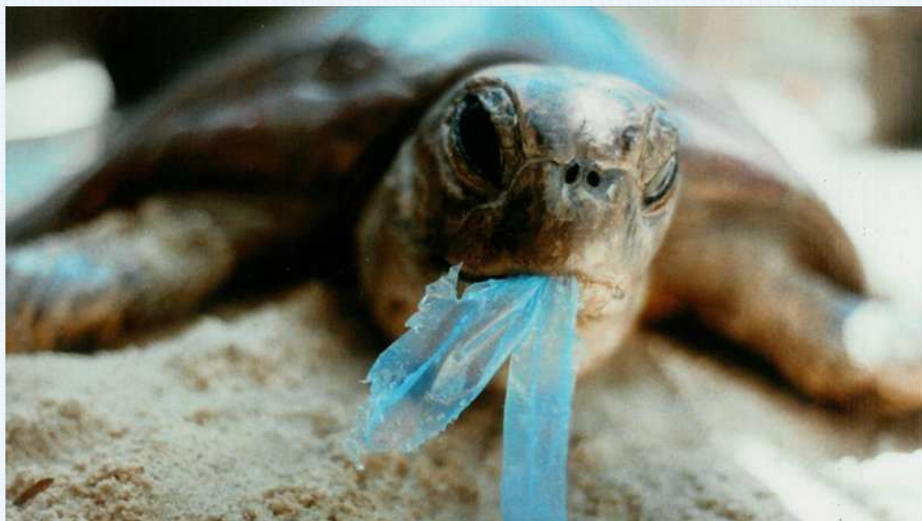
Immagine della Plastica ..... tra Marine Littering e Riciclabilità.